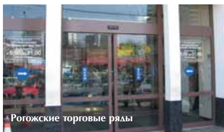
Рогожские торговые ряды