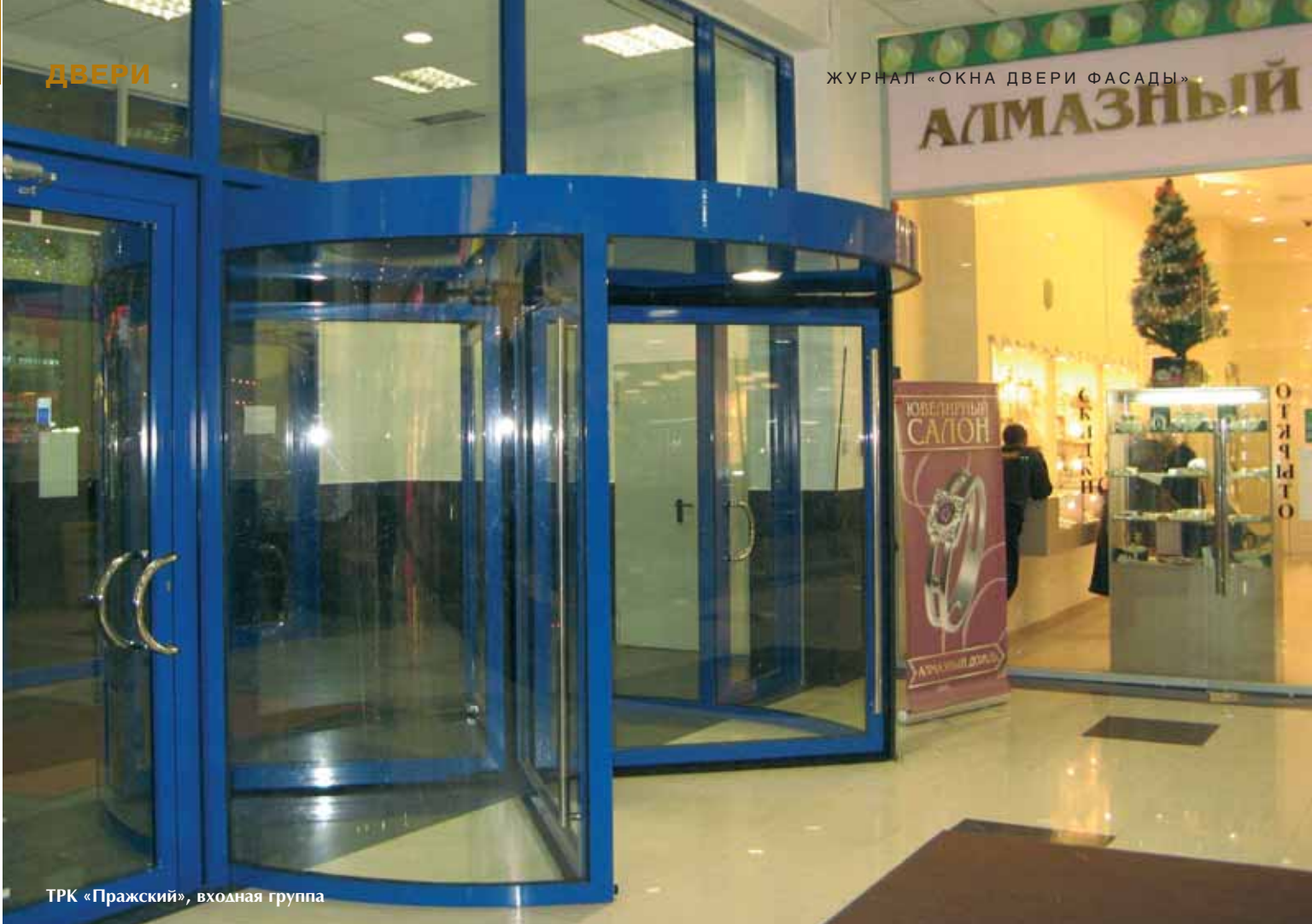
ТРК «Пражский», входная группа